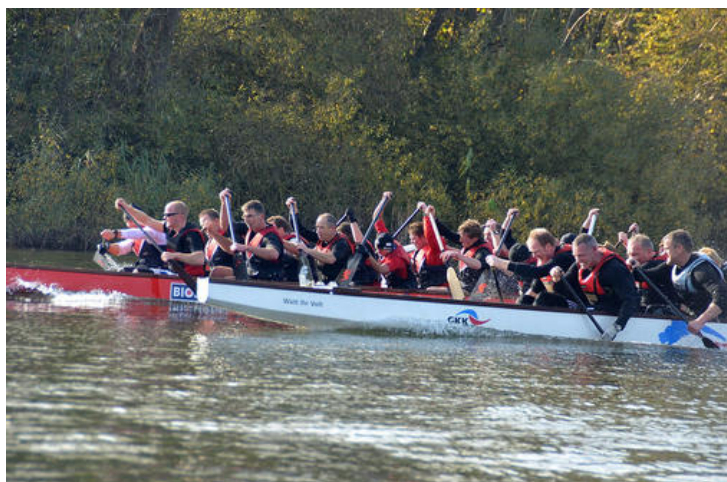
Ein packendes Finish um Platz zwei lieferten sich die Rendsburger und Schellhorner Drachenboote. Am Ende lag das weiße Boot um eine Bugspitze vorn.

„Are you ready? Go!“ Lautstark kommt vom Ufer das Start-Kommando für die Drachenboote. Und dann geht die Post geht ab auf dem Wasser des Lanker Sees. Die Schlagzahl ist hoch. Die Paddel wirbeln nur so durch die Luft.